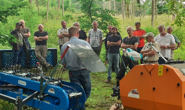
Technikvorführung, © Andreas Bergmann, LPV Wittstock